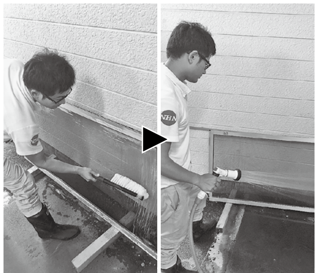
クリーニングサービスも行う